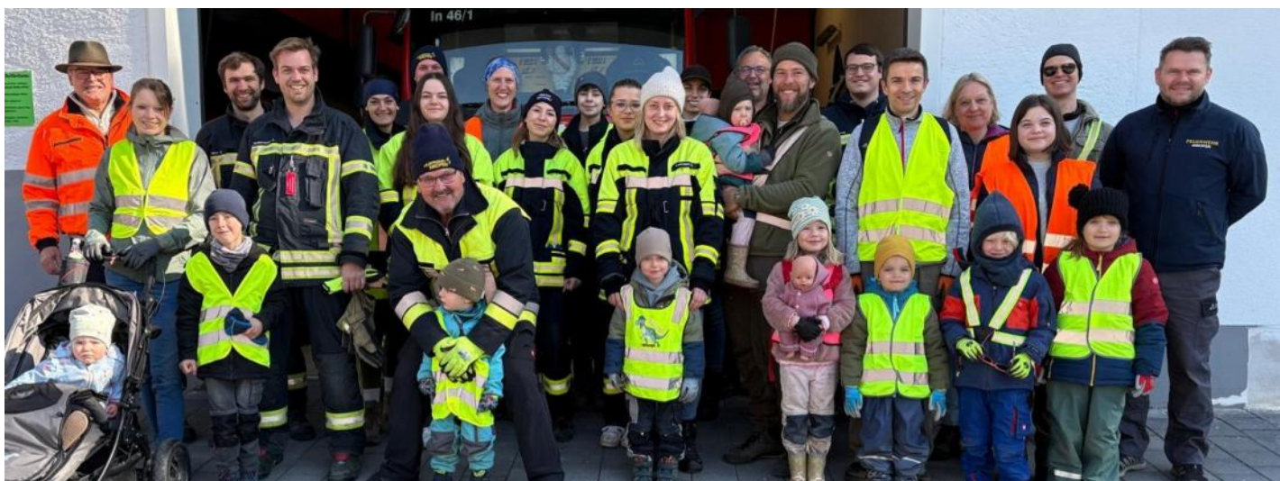
Auch in Inkofen kamen bei strahlendem Sonnenschein viele Ehrenamtliche zusammen.