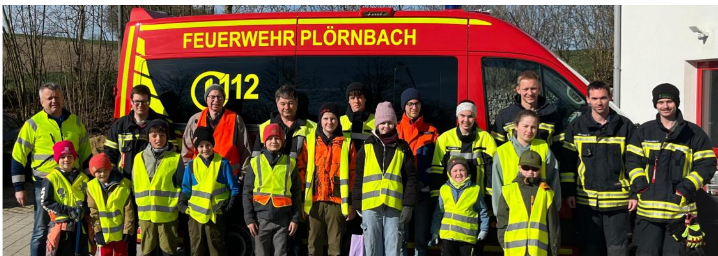
Im Marchenbachtal schien ebenfalls die Sonne, weshalb das Sammeln des Unrats entlang der Kreisstraße umso leichter fiel.

Insgesamt liefen heuer am Samstag, den 28. März, 80 Helferinnen und Helfer bei der Aktion saubere Landschaft mit. Die Gemeinde bedankt sich bei allen Ehrenamtlichen für ihren Einsatz.