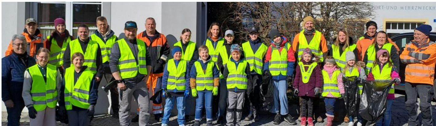
Am Dorfplatz versammelten sich die Helfer in Haag, im Anschluss aß man gemeinsam am Bauhof.