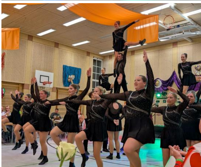
Helau, Alaaf und bis bald! Euer Faschingsorganisationsteam KKH (= Kreativkreis Konfetti Haag) des Gemeindefaschings Haag